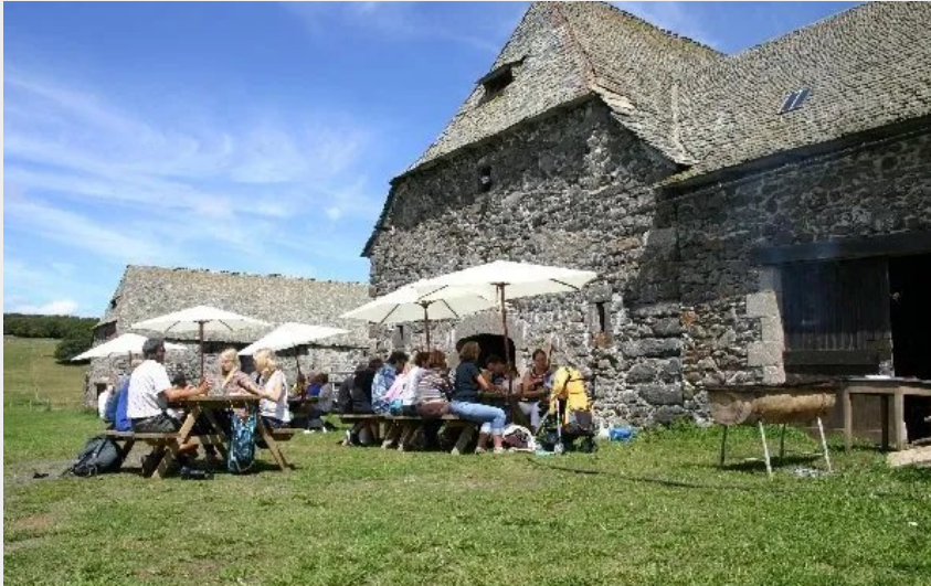
Crédit : Buron des Bouals (OFFICE DE TOURISME DE CONDOM ET SAINT CHELY D'AUBRAC)