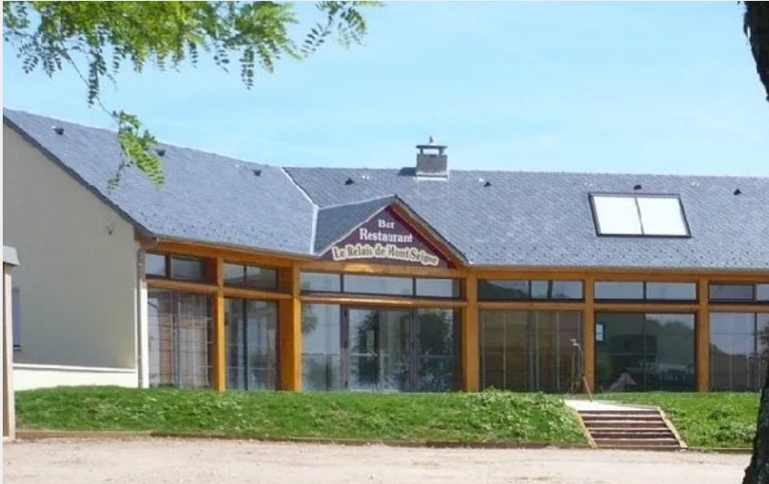
Crédit : Le Relais du Montseigne (OFFICE DE TOURISME DE PARELOUP LEVEZOU)