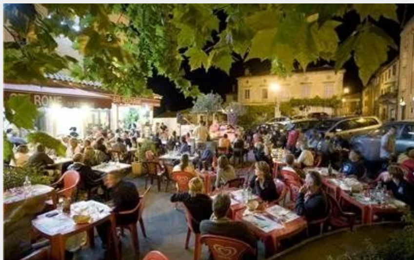
Crédit : Soirée en terrasse de l'Auberge de St-Rome (Auberge de St-Rome)