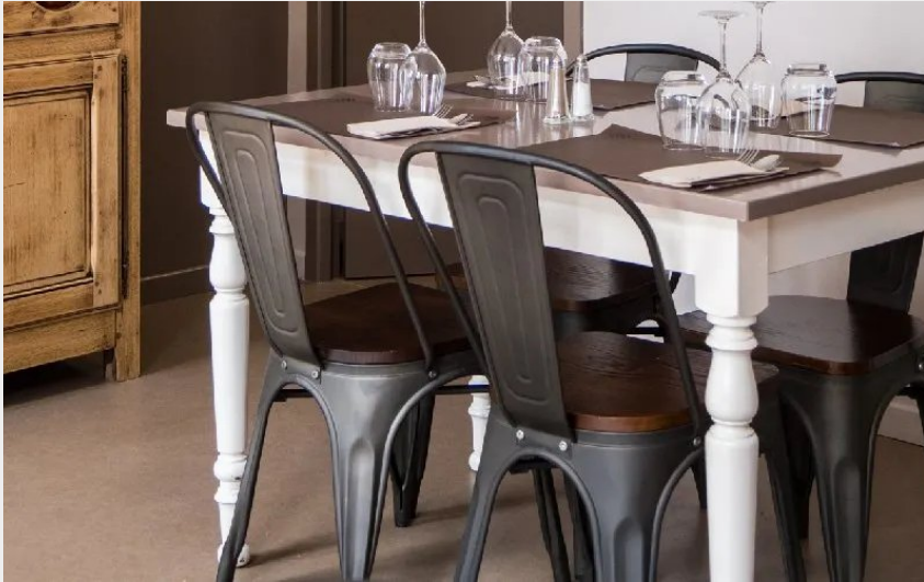
Crédit : La Petite Halle (OFFICE TOURISME DU PAYS DE LA MUSE ET RASPES DU TARN)