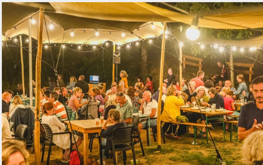
La guinguette du Bénéfire