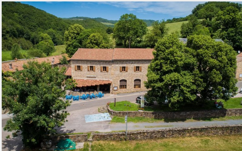
Crédit : Vue du restaurant dans un écrin de verdure