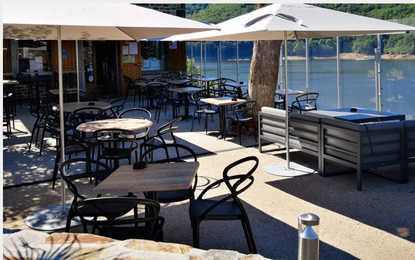
Crédit : La Chalet du lac, et la terrasse du bar.