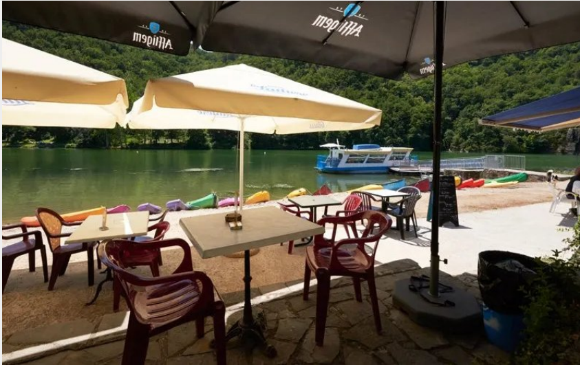
Crédit : Le Resto du Mas de la Nauc (OFFICE TOURISME DU PAYS DE LA MUSE ET RASPES DU TARN)