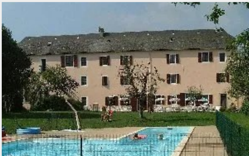
Crédit : Les sentiers de la découverte - Restaurant (OFFICE DE TOURISME DE PARELOUP LEVEZOU)