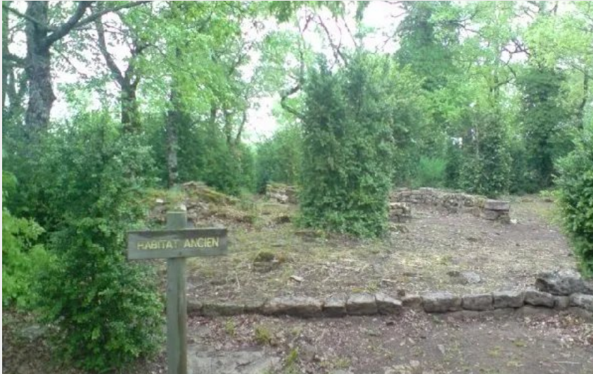
Espace du Sabel : le Mas Viel