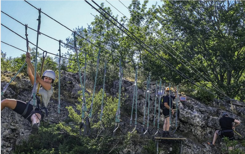
Crédit : Accro Roc - Parcours Aventure (Virginie Govignon - OT Larzac Vallées)