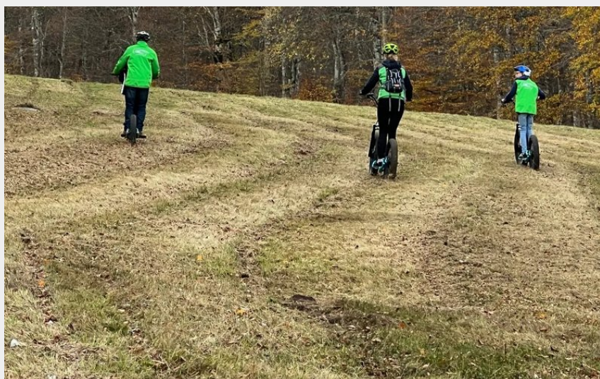
Trottinette station de Brameloup et Laguiole