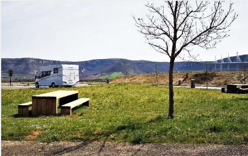
Aire de pique-nique de Brocuéjous