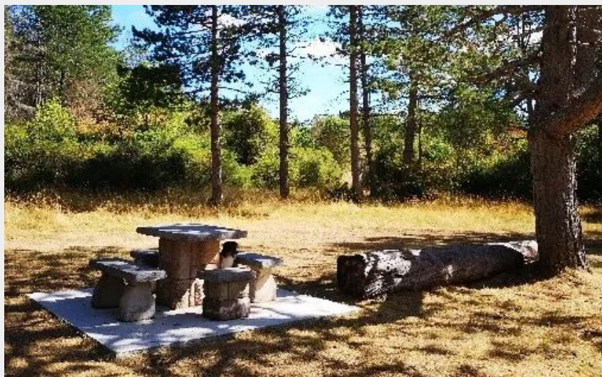
Aire de pique-nique du Cade