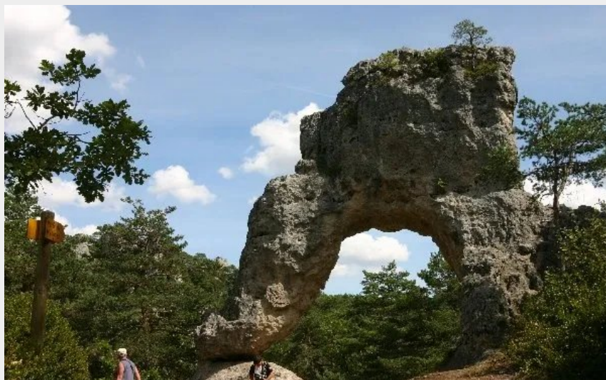
Crédit : La Porte de Mycène - Chaos rocheux du Causse Noir (Parc de Loisirs de Montpellier-le-Vieux)