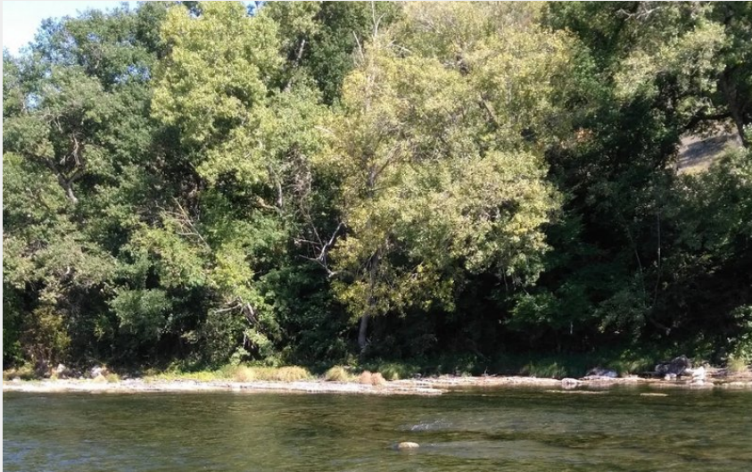
Crédit : Kayaks Franconne - Location de kayaks monoplaces (Kayaks Franconne)