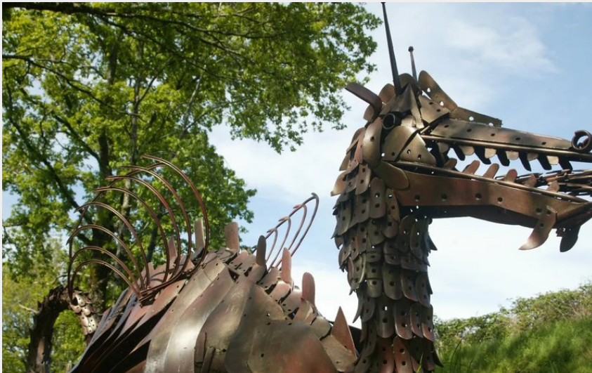
Blaise le dragon, gardien du sentier