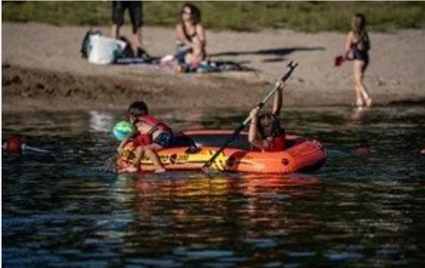
Crédit : Plage des Rousselleries (Crédits: © G. Alric - Tourisme Aveyron)