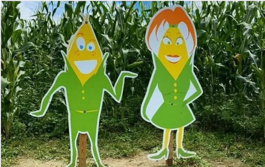
Pop Corn labyrinthe