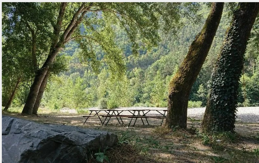
Aire de pique-nique de Rivière-sur-Tarn