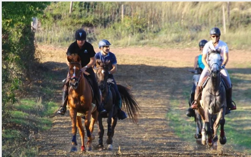
Crédit : Piste de galop de la Cazotte (Lycée Agricole de la Cazotte)