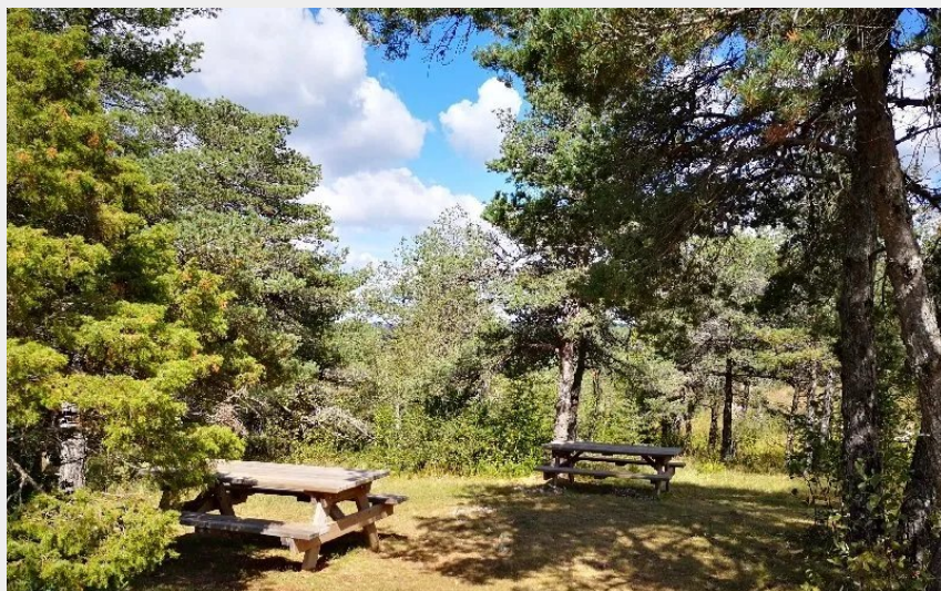
Crédit : Aire de pique-nique de Roquesaltes (OFFICE DE TOURISME DE MILLAU)