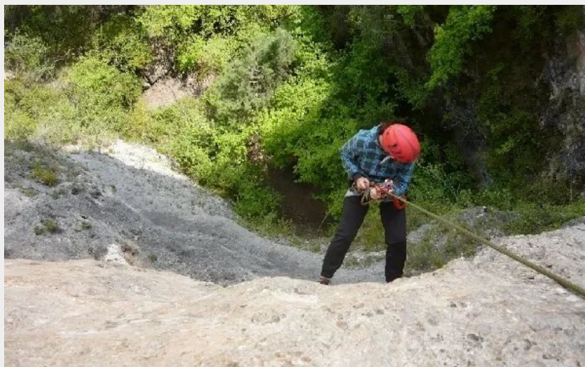
Crédit : Causses Émotions rappel géant (Causses Émotions rappel géant)