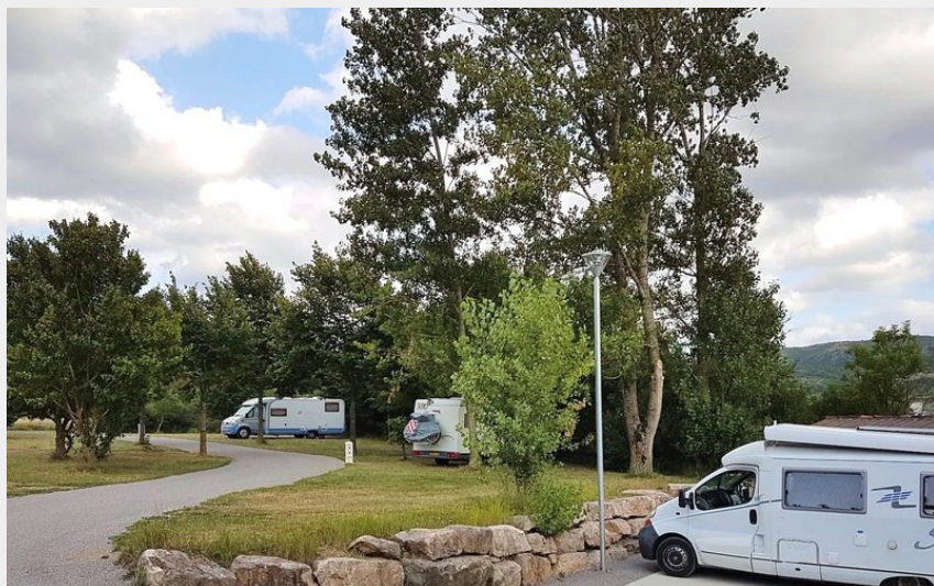
Crédit : Aire de camping-cars de Sainte-Eulalie de Cernon (Thierry CADENET)