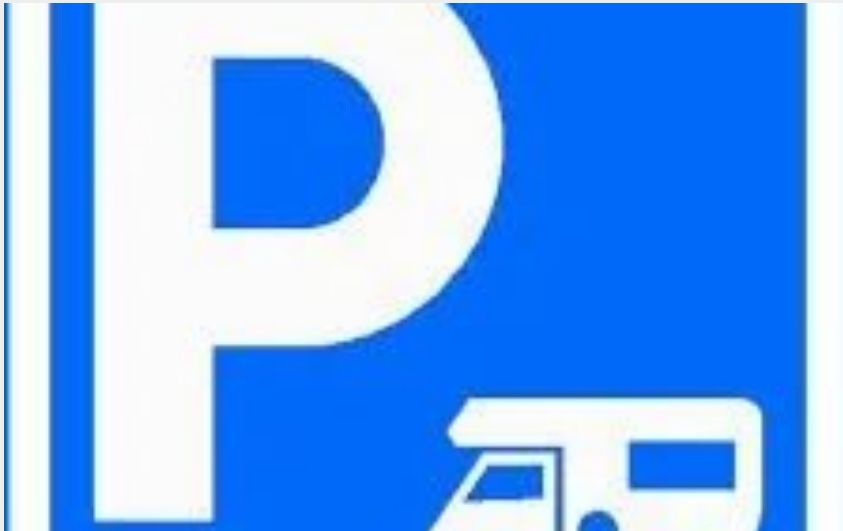
Crédit : Aire municipale de stationnement camping-car à St Geniez d'Olt