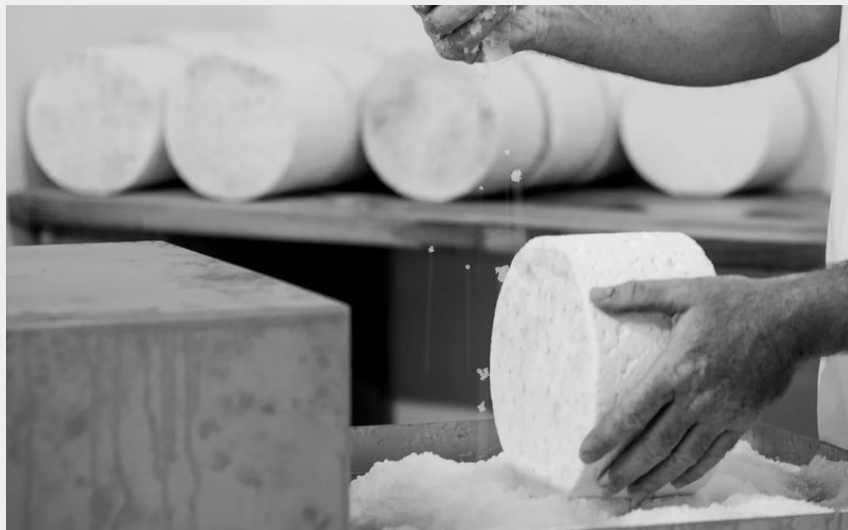
Crédit : Ferme d'Alcas - visite / exposition - dégustation (Ferme d'Alcas)