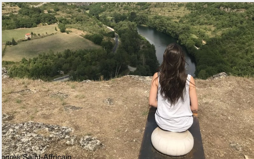
Près de Saint-Affricain