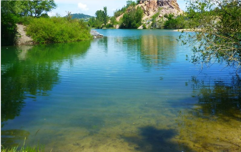
Crédit : Pêche au Lac de la Cisba (Office de Tourisme des Causses à l'Aubrac)