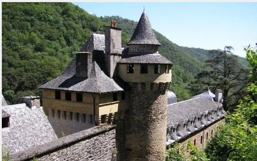
Abbaye de Bonneval