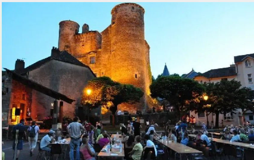
Crédit : Château de Coupiac. Le marché de pays. (Cliché Didier Panis)