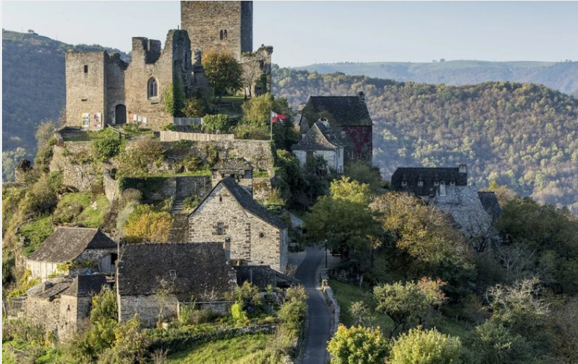
Crédit : Château de Valon (OFFICE DE TOURISME DU CANTON DE MUR DE BARREZ)