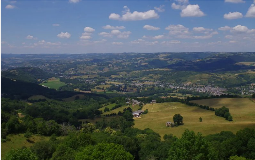
Crédit : Panorama sur la vallée du Lot depuis le château de Roquelaure (3CLT)