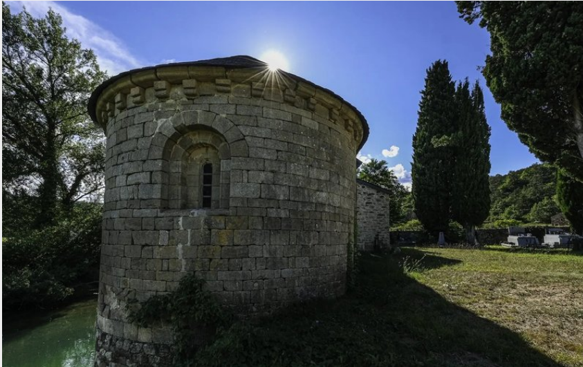
Chapelle St-Amans de Valsorgue