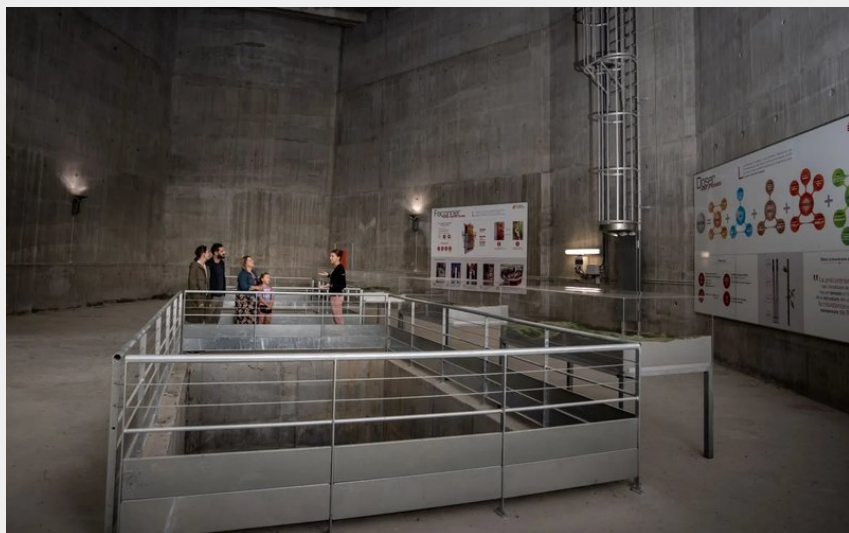
Crédit : Viaduc de Millau: sur les anciennes pistes de chantier (Viaduc de Millau)