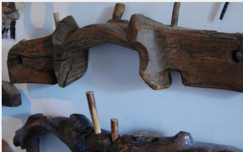
Crédit : Joug (Collection du musée) (Château / Musée de la vie rurale / Musée de la pierre)