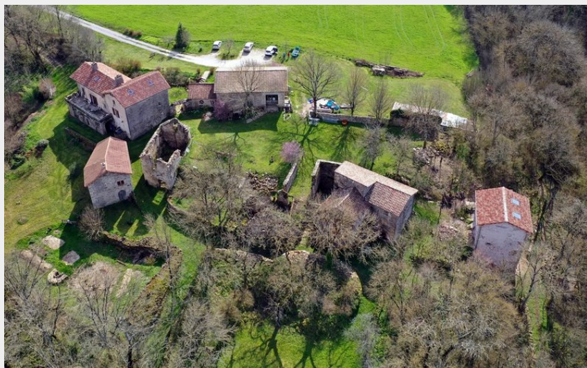
Crédit : vue aérienne du hameau