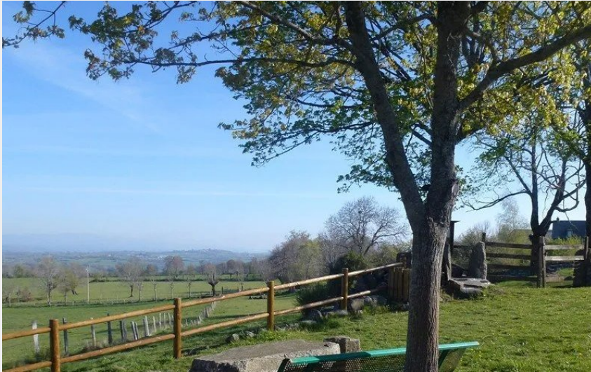
Crédit : Micro-musée de la vie paysanne à Durbec (Office de tourisme Argences en Aubrac)