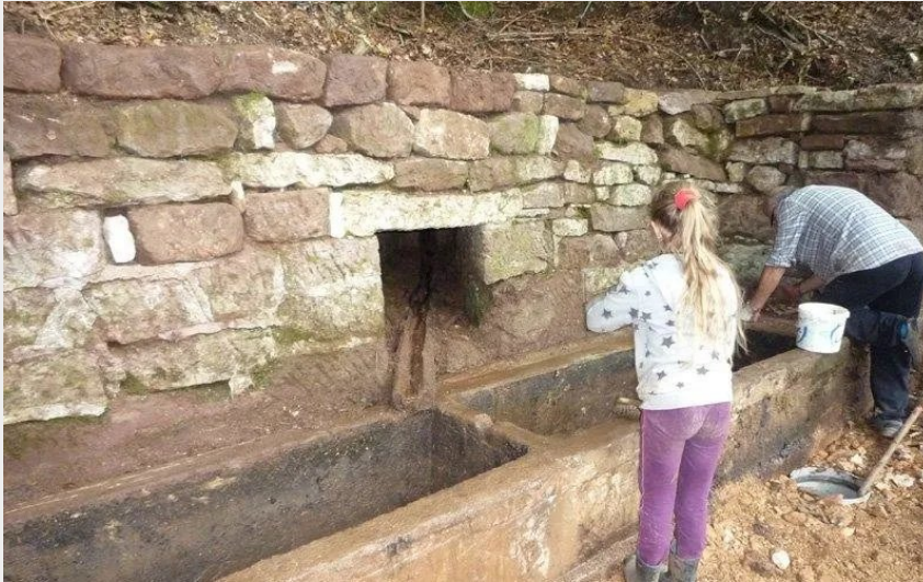
La Fontaine des Barthes