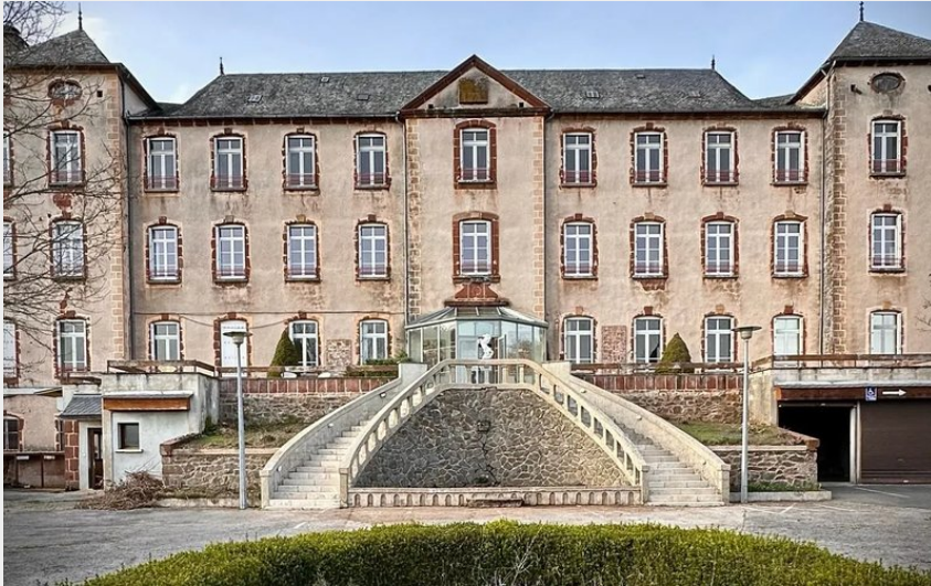
Crédit : Château des Hermeaux St Laurent d'Olt (Frédéric Luca Landi)