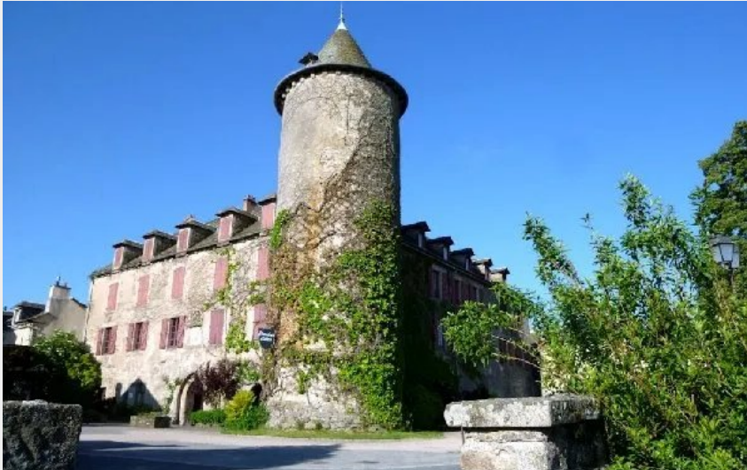
Crédit : Château des évêques (OFFICE DE TOURISME DE SALLES CURAN - PARELOUP)