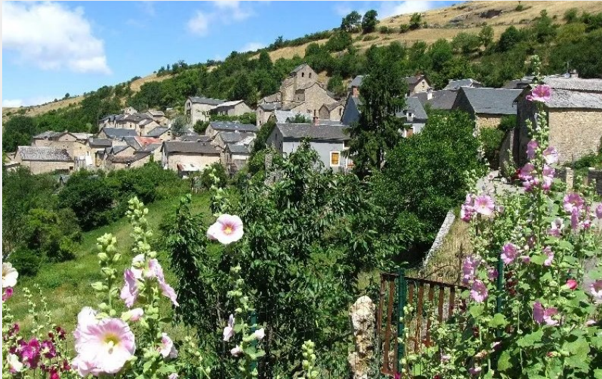
Crédit : Village de caractère- Saint Grégoire (OFFICE DE TOURISME DE SEVERAC LE CHATEAU)