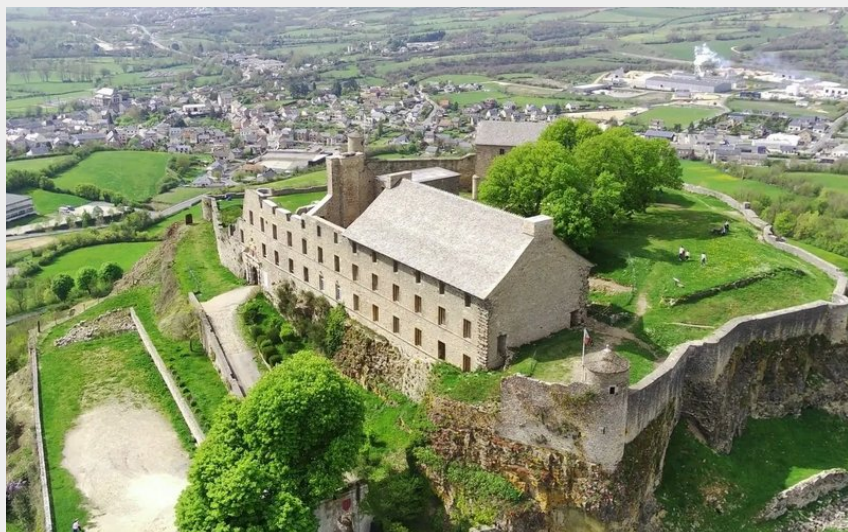
Crédit : Château de Sévérac (Office de Tourisme des Causses à l'Aubrac)