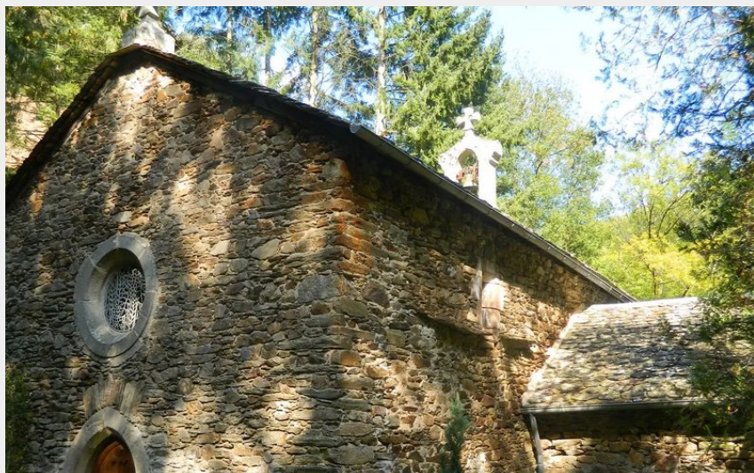
Crédit : Chapelle St-Cyrice et Sentier d'interprétation (Mairie du Truel)