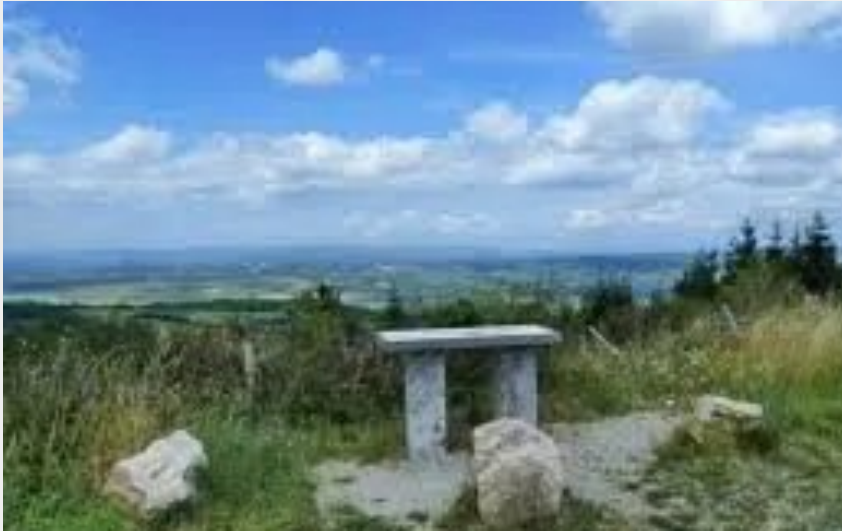
Crédit : Table d'orientation de Beaugard (OFFICE DE TOURISME DE PARELOUP LEVEZOU)