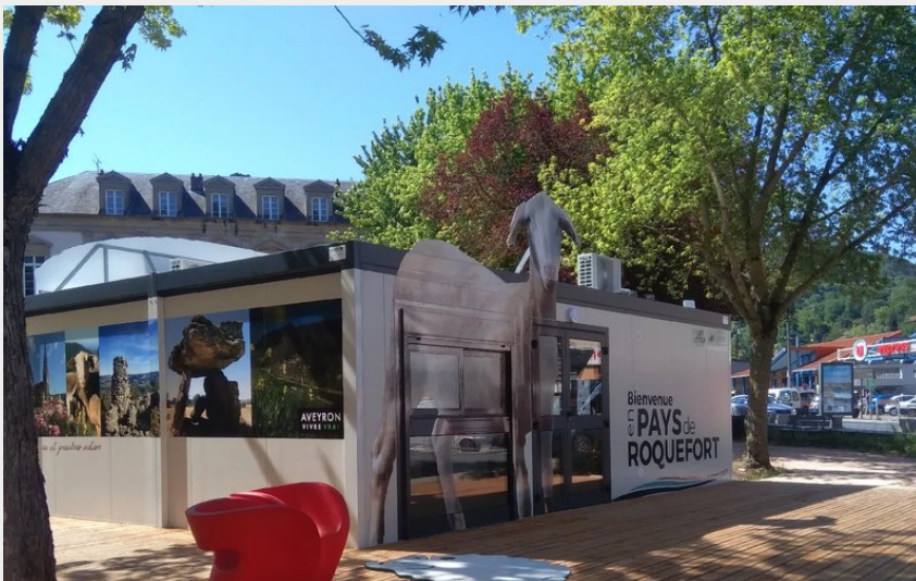
Crédit : Office de Tourisme Pays du Roquefort. Point Info Tourisme (ROQUEFORT TOURISME)