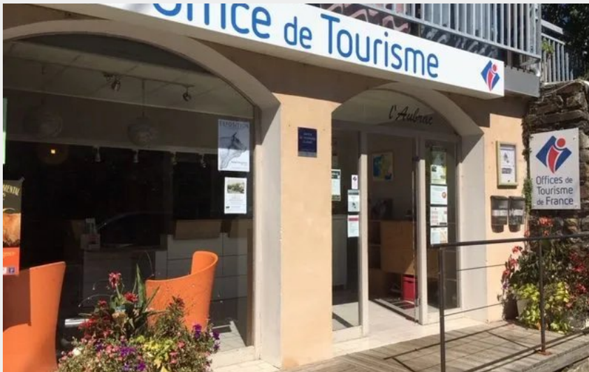
Crédit : Tourisme en Aubrac - Bureau de Saint-Chély-d'Aubrac (OFFICE DE TOURISME DE LAGUIOLE)