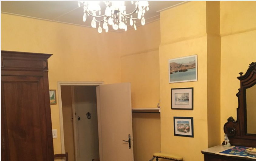
Crédit : Gîte 4 personnes - Château de Saint Pierre_Trébas