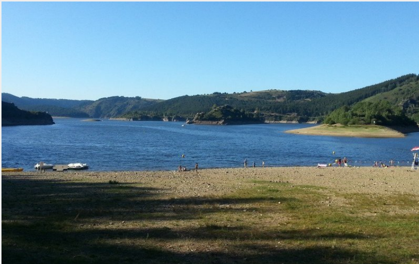
Crédit : Plage de baignade de Mallet