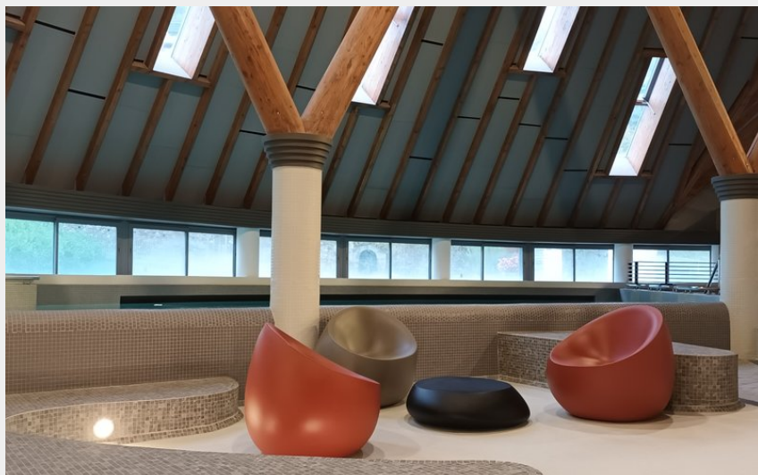
Crédit : Espace thermoludique de Caleden_Chaudes-Aigues (OT les Pays de St-Flour)