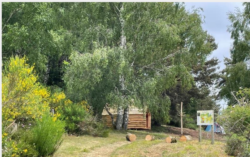
Crédit : Aire d'éco-bivouac de Morsanges à Maurines_Maurines (PNR Aubrac)