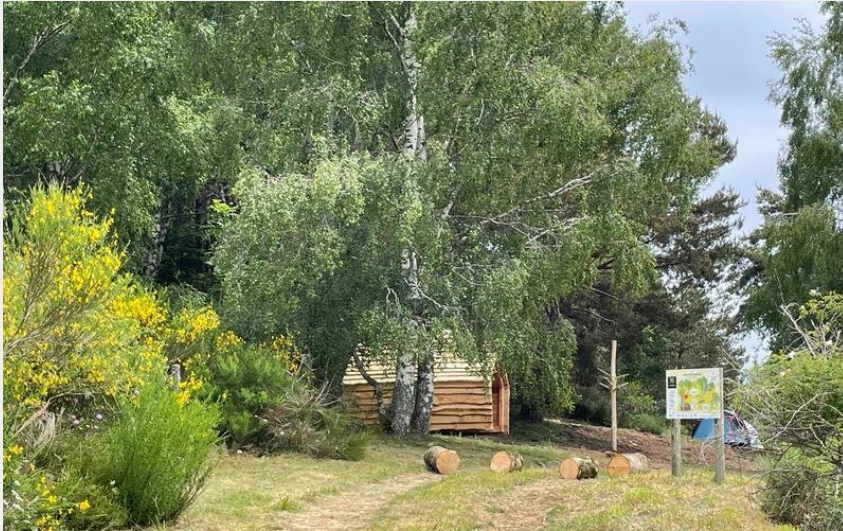
Crédit : Aire d'éco-bivouac de Morsanges à Maurines_Maurines (PNR Aubrac)